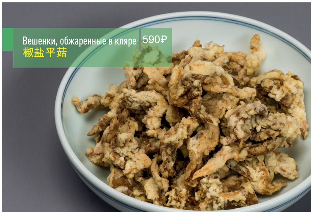
Вешенки, обжаренные в кляре 590₽ 椒盐平菇