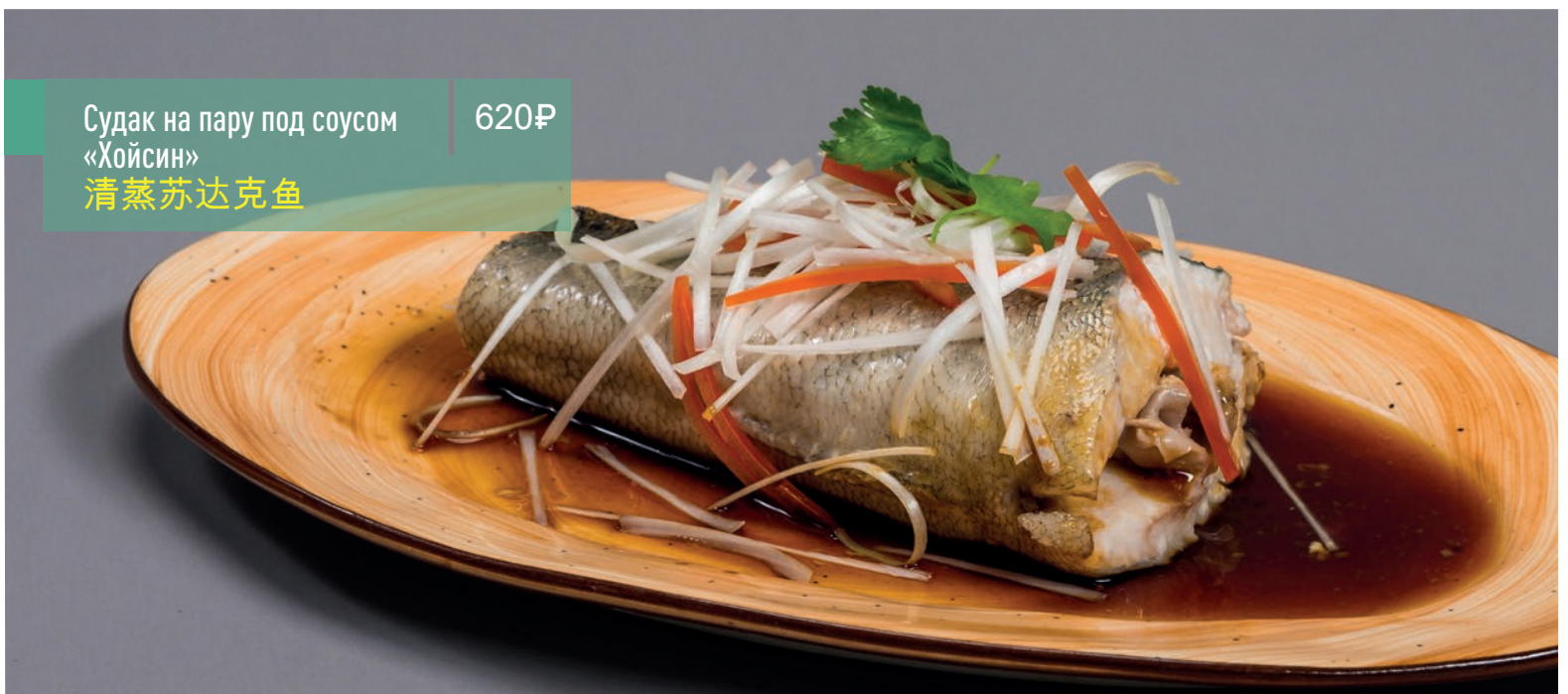
Судак на пару под соусом «Хойсин» 清蒸苏达克鱼