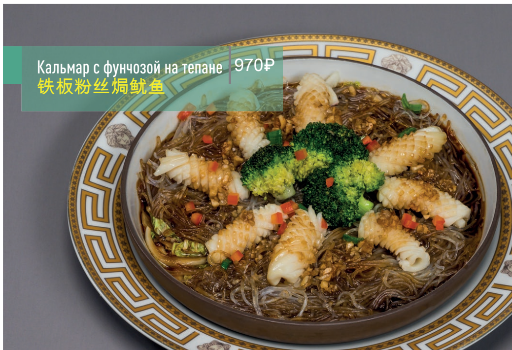
Кальмар с фунчозой на тепане 970₽ 铁板粉丝焗鱿鱼