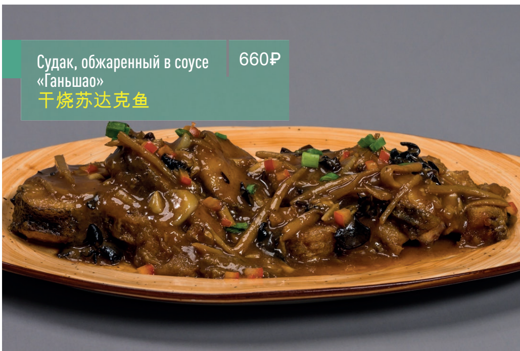
Судак, обжаренный в соусе «Ганьшао» 干烧苏达克鱼